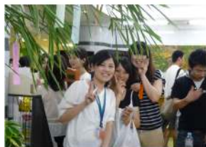
←《7月7日に行った七夕ランチョンパーティー》自分の願いを色々な国の言葉でどのように書き表すか、留学生に教えてもらいながら短冊に書き込みました。昼休みのツーリズム館入口ホールは大盛況！