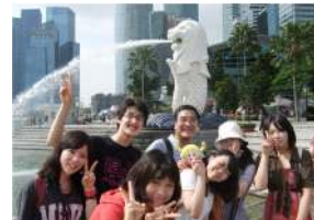
↑ ホテル学科夜間部 シンガポールのシンボル、マーライオンの前で。

2011 年度の海外研修旅行は、エアライン学科 1 年次生が 2011 年 9 月に台湾へ、ホテル学科・トラベル学科 2 年次生が 2012 年 2 月にシンガポールに行ってきました。エアライン学科では、エバー航空様で客室乗務員訓練の 1 日体験をおこないました。