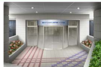
↑ テーマパークをイメージしたツーリズム館エントランスのバース図