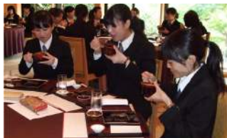
↑ お箸やお椀の正しい持ち方をはじめとした「会席料理のマナー」についてのレクチャーを受けた後、本格的な会席料理を美味しくいただきました。↑