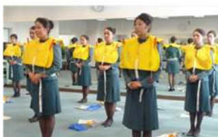
↑ エアライン学科 エバー航空でのセーフティーデモンストレーション。