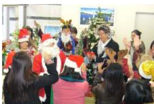
↓《12月22日に行ったクリスマスパーティー》高さ2mのクリスマスツリーを囲んで盛り上がる学生たち。