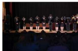
←本校の標語になっている「笑顔と挨拶」を、先輩の指導の下さっそく練習。