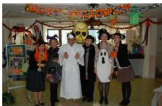
↑《10月31日に行ったハロウィーンパーティー》学生を楽しませるために扮装して下さった教職員の皆さん。

どのイベントも盛況であり、学生たちは同じ学校に様々な国の学生が学んでいることの豊かさを感じたようです。