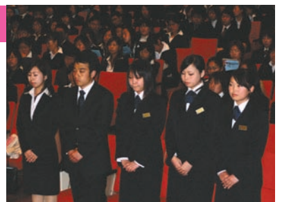
▲在校生の成績優秀者の表彰