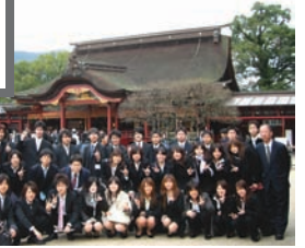
国内研修旅行(太宰府天満宮)▶