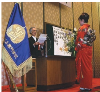
▲平成18年度卒業式(於:ホテルオークラ東京)

平成18年度・第27回卒業式が、平成19年3月15日(木)、ホテルオークラ東京(平安の間)にて行われ、約500名の卒業生が社会人として旅立ちました。西岡久雄校長からは、「本校で育んだ様々な思い出と友情を胸に、元気で社会に羽ばたいてください。また時には母校を訪れて近況を教えてください」とのほなむけの言葉をいただきました。