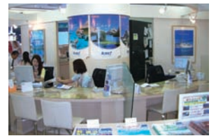
有楽町交通会館 1階

「旅行業界に入りたい」という同じ目標を持った仲間と過ごした何気ない毎日が楽しかったし、皆輝いていたと思います。野球部の夏の大会や、お揃いのクラスTシャツを作って臨んだ体育祭は、今思い出しても熱くなります。