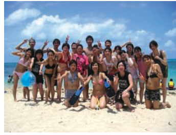
▲海外研修旅行(グリーン島)

毎年恒例の本校研修旅行が昨年12月も実施され、楽しく旅程を過ごすことができました。ホテル学科2年C組の海外研修先はオーストラリア/ケアンズ、トラベル学科1年生の国内研修(阿蘇、別府、福岡)の写真を掲載しました。