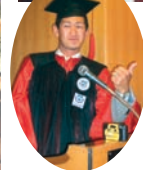
▲平成18年度卒業式後の卒業記念パーティ