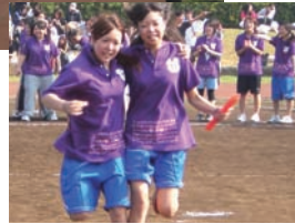
▲お揃いのクラスTシャツ姿のホテル学科生