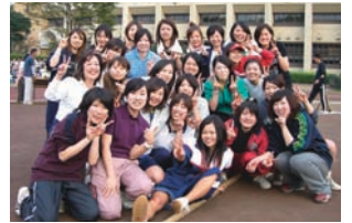
▲綱引き優勝チーム エアライン・ビジネス学科(現2年生)